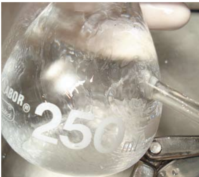
Como acaba a água: limpa

às empresas enquadradas nas normas internacionais ISO 9000/1/2 e 14000”.